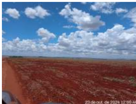
- Talhão de Terra - Matrícula 7.681:

www.acfb.com.br E-mail: contato@acfb.com.br | Telefone: (11) 3230 6822 CT