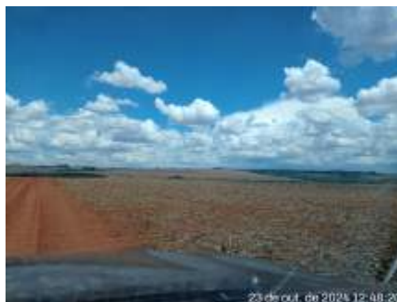
- Talhão de Terra - Matrícula 7.685: