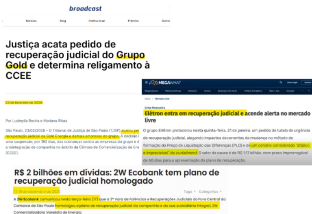
Figura 3 - Casos recentes envolvendo agentes relevantes do mercado livre de energia elétrica, com adoção de medidas de recuperação judicial e decisões voltadas à preservação da continuidade operacional (inclusive perante a CCEE), evidenciando a disseminação da crise no setor e o aumento do risco sistêmico.

Ainda, recente caso envolvendo a Eletron Energia demonstra que a crise no mercado livre tem levado agentes a recorrer ao regime recuperacional como instrumento de reorganização econômico-financeira, diante da elevação de preços, restrição de liquidez e aumento do risco contratual. 9